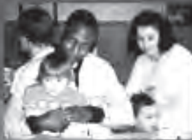
Gemeindeförderung mit Tauschen und Erntedankfest