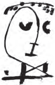
Paul Klee: Alas!, Ach, aber ach!

Veranstaltung der Frauenarbeit im Amtsbereich Garbsen-Seelze am Samstag, den 8. November 2008 von 14.00 – 18.00 Uhr im Kirchenzentrum Silvanus