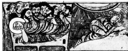
„Schlafender“ und „Christus in Getsemani“ aus dem Stuttgarter Psalter