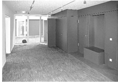
Die neuen Gemeinderäume am Umzugstag im Februar

Die Kirchengemeinde freut sich doppelt: es stehen 150 m 2 komplett sanierte, helle und freundliche Räume